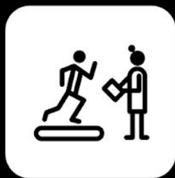
Programa de acondicionamiento físico