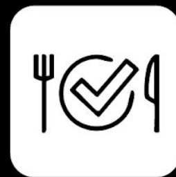
Programa de nutrición virtual