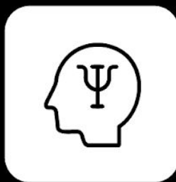
Programa de atención médica